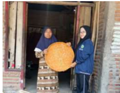
Gambar 6. Produk Jadi Anyaman Bambu ( Tampah )

Proses finishing merupakan proses terakhir dari tahap-tahap sebelumnya selesai dikerjakan. Barang-barang yang telah jadi di samping dilihat dari segi, kualitas pengerjaan juga penampilan fisiknya atau finishingnya. Finishing memegang peranan penting dalam menghadirkan produk dari bambu, bahkan pengerjaan yang kurang baik dapat menggagalkan produk yang dibuat. Finishing harus dilakukan dengan teliti dan hati-hati agar tidak kehilangan nilai dari karya tersebut. Proses finishing biasa dilakukan dengan cara mengecek kondisi produk jadi apakah masih ada anyaman yang kurang rapi maupun masih ada bagian yang belum rata dalam proses pewarnaannya.