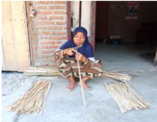
Gambar 2. Proses Pemotongan, Peng-irat-an Dan Penghalusan Bahan Anyaman Tampah

Tahap awal adalah melakukan penebangan bambu membersihkan ranting-rantingnya. Pemotongan bambu dapat dilakukan dengan menggunakan parang atau gergaji. Pemotongan dilakukan dengan hati-hati, pemotongan batang bambu untuk bahan anyaman dianjurkan untuk memakai gergaji potong yang bergigi halus. Untuk bambu jika kulit batang digunakan, hendaknya diusahakan jangan sampai kulit tersebut terkelupas, terutama waktu pemotongan ruasnya. Untuk bahan anyaman, panjang ruas bambu yang ideal adalah 50 atau 60 cm. Tahap selanjutnya adalah melakukan pembelahan bambu yang sudah dibersihkan dan dipotong. Cara yang dapat dilakukan yaitu; mula-mula bambu dibagi dua sama besar, lalu masing-masing bagian dibagi dua lagi sehingga setiap bagian berukuran seperempat.