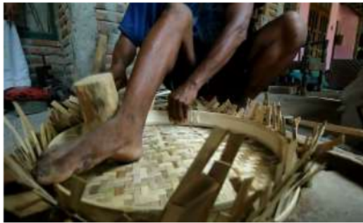
Gambar 4. Proses Pemberian Pegangan Pada Tampah

Setelah proses dasar pengayaman selesai, hasil anyaman kemudian diberikan batasan yang berbentuk bulat atau bundar dengan bahan baku bambu yang dipotong agak tebal kemudian dipress atau dipadatkan dan tali menggunakan serat bambu tipis sehingga bisa digunakan untuk pegangan dalam menggunakan produk tampah tersebut.