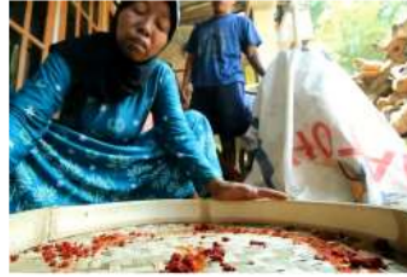
Gambar 5. Proses Pewarnaan Dengan Bahan Alami

Proses pewarnaan digunakan untuk memperindah atau memberikan motif pada produk sehingga dapat menarik daya beli konsumen. Bahan yang digunakan dalam proses pewarnaan ialah bahan alami sehingga dapat meminimalisir modal dalam proses pembuatan produk. Bahan alami tersebut ialah air sari kunyit, kunyit yang telah dihaluskan atau diparut kemudian dicampur oleh air akan memberikan corak warna jingga sehingga dapat digunakan sebagai bahan untuk proses pewarnaan. Setelah anyaman ( Tampah ) diberikan pewarna, proses selanjutnya ialah proses penjemuran, proses penjemuran tidak memakan waktu lama hanya sekitar satu hari dengan terik matahari secara penuh.