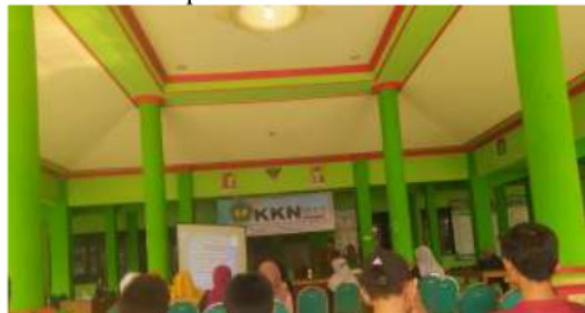
Gambar 1. Diskusi Dan Pelatihan Pembuatan dan Pemasaran Produk Anyaman Yang Diikuti Oleh Para Pengrajin Anyaman Bambu Di Desa Krangkong

karena kebutuhan pasar yang masih cukup tinggi di wilayah pedesaan khususnya di kecamatan Kepohbaru.