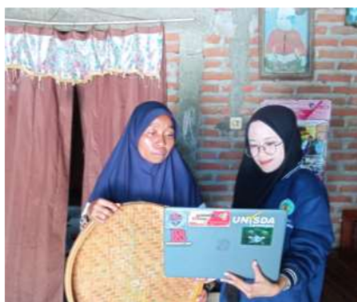
Gambar 7. Pemberian Pengetahuan Kepada Pengrajin Untuk Pemasaran Produk Melalui Media Masa

pertemuan dimana setiap pertemuan dilaksanakan selama 5 jam, namun apabila masih diperlukan maka akan dilakukan penambahan waktu. Pelatihan ini bertujuan untuk: (1) meningkatkan pengetahuan dan jiwa wirausaha para pengrajin; (2) meningkatkan kemampuan pembukuan usaha; (3) meningkatkan pengetahuan dan kemampuan manajemen usaha terutama manajemen pemasaran secara langsung maupun dengan cara mempromosikannya melalui media masa dalam rangka meningkatkan pendapatan usaha.