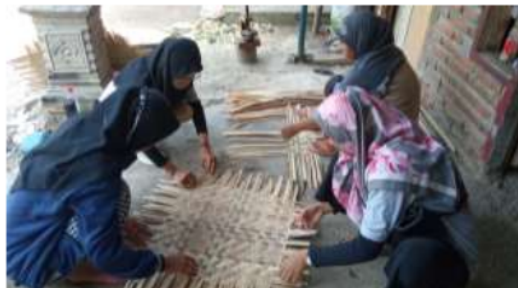
Gambar 3. Proses Pengayaman Dasar Tampah

Proses menganyam ialah metode memberi petunjuk agar dapat membuat anyaman dengan semudah-mudahnya dan membawa hasil yang sebaik-baiknya. Proses ini membutuhkan ketrampilan khusus para pengrajin dalam menyusun bahan baku bambu yang sudah di potong dan dihaluskan dengan menggunakan cara menganyam sehingga menjadi pola yang terstruktur. Cara ini biasa dilakukan oleh pengrajin dengan menyusun beberapa helai bambu yang sudah dipotong dan dihaluskan dengan metode penyusunan secara menyilang dalam posisi helai bambu dalam posisi vertikal dan horizontal.