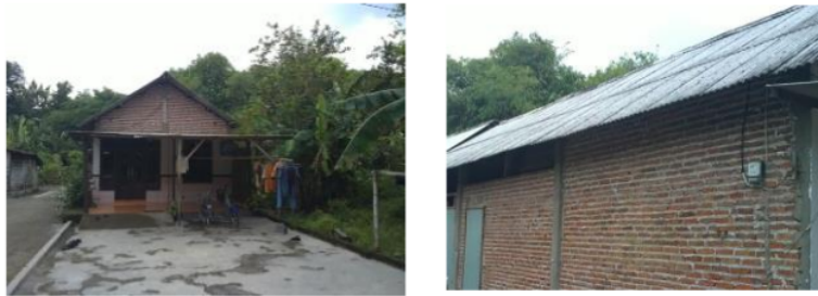
Gambar 4. Pemanfaatan material bangunan berbahaya pada fisik bangunan rumah

kondisi fisik bangunan yang telah menggunakan bahan yang layak, basis yang memadai dan bangunan fisik yang dapat memberikan kebutuhan perlindungan perumahan.