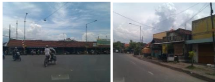
Gambar 6 Pertumbuhan sektor perdagangan di Kecamatan Tulangan

Keberadaan Pusat Kegiatan Komersial (dalam bentuk pasar) yang berlokasi di desa Wonoayu, berkontribusi pada sektor pertumbuhan di Kecamatan Tulangan. Keberadaan pasar ini berdampak pada tren pertumbuhan toko-toko (toko) yang terletak di sepanjang jalan raya besar di Distrik Tulangan.