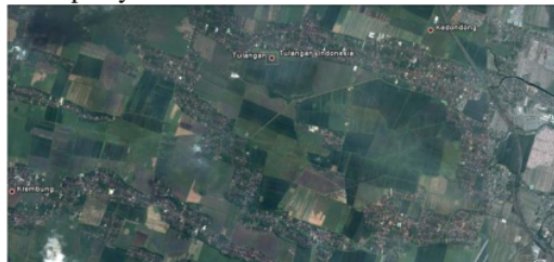
Gambar 2. Visualisasi persebaran lahan terbangun terhadap keberadaan jaringan jalan

Kecamatan Tulangan merupakan salah satu kecamatan yang tergabung dalam wilayah administrasi Kabupaten Sidoarjo dan terbagi kedalam 22 desa / kelurahan. Berdasarkan pada jenis pemanfaatan lahannya, Kecamatan Tulangan terdiri dari beberapa jenis kegiatan pemanfaatan lahan. Pemanfaatan lahan ini didominasi oleh peruntukan permukiman mandiri dengan tipologi permukiman pedesaan dan kegiatan pertanian-perkebunan & budidaya tambak. Komposisi pemanfaatan lahan lainnya adalah kegiatan perdagangan dan jasa yang mayoritas adalah tergolong kedalam sektor non-formal dengan skala pelayanan lokal.