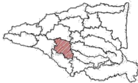
Gambar 1 Lokasi Kecamatan Tulangan dalam administrasi Kabupaten Sidoarjo

Untuk mendukung penulisan ini, proses penelitian ini dilakukan dengan melakukan tinjauan kontekstual dari proses dan hasil pembangunan yang dilakukan, terutama di Kabupaten Sidoarjo, Jawa Timur. Ruang lingkup area yang digunakan dalam penelitian ini adalah salah satu kecamatan yang termasuk dalam pemerintahan Kabupaten Sidoarjo, yaitu Kabupaten Tulangan. Berikut ini adalah orientasi peta lokasi kecamatan Tulangan dalam administrasi Kabupaten Sidoarjo.