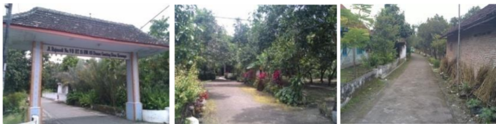
Gambar 3. Kondisi lingkungan permukiman di Kecamatan Tulangan

Menurut tipologi, perumahan dan permukiman yang terdapat dalam kecamatan Tulangan diklasifikasikan sebagai pada tipologi likuidasi pedesaan. Berdasarkan pengamatan yang dilakukan, kondisi fisik likuidasi di Kecamatan Tulangan sangat bervariasi. Tetapi tergantung pada pengamatan yang dilakukan secara menyeluruh, sebagian besar kondisi perumahan di subdit TULANGAN dapat diklasifikasikan ke permukiman yang dapat dihuni.