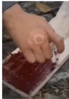
Tahap 4. Finishing dengan proses pengecatan