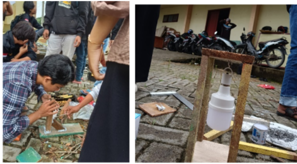
Tahap 3. Merakit kayu sesuai dengan model yang ditetapkan