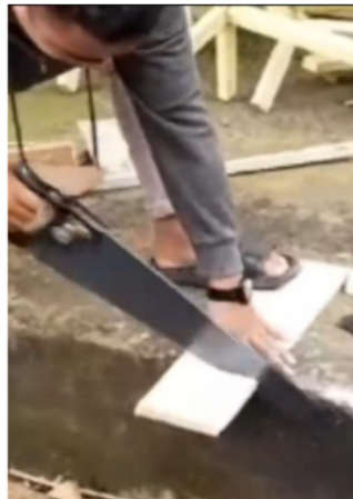
Tahap 2. Memilih limbah kayu dan memotong sesuai ukuran