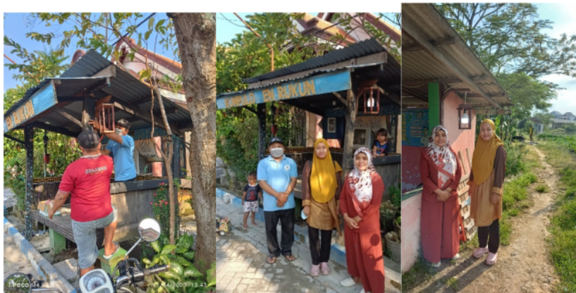
Gambar 5. Pos Kampling dengan Penerangan lampu LED bolham emergency.

Dalam proses pemasangan furniture lampu dari limbah konstruksi dan lampu LED bolham emergency ini, melibatkan Ketua RT setempat. Perletakan lampu dipilih pada titik eksterior yang tidak terkena hujan. Dalam pemasangannya lampu yang sudah dibuat dibawa ke pos kampling yang sudah dipilih tempatnya, kemudian ditempelkan pada dinding/kolom pos kampling menggunakan paku. Setelah perletakan lampu selesai dipasang, barulah lampu LED bolham emergency dipasangkan ke dalam pitingan.