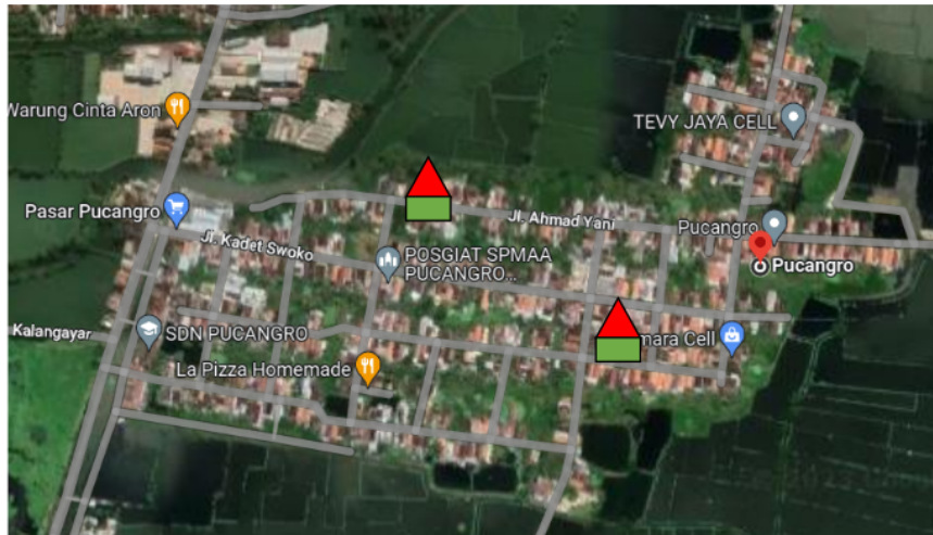
Gambar 2. Penentuan Titik Lokasi