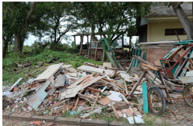
Gambar 3. Limbah Kayu Konstruksi

Pembuatan perletakan lampu melibatkan dosen dan mahasiswa Prodi Teknik Sipil Universitas Islam Darul 'Ulum Lamongan. Adapun matrial yang digunakan untuk furniture lampu atau perletakan lampu adalah kayu limbah konstruksi. Menurut Meditama (Meditama, 2022) bahan yang digunakan dalam suatu penelitian sebagiknya bahan yang mudah didapat akan tetapi memiliki nilai fungsi, bahan bisa diolah menjadi produk yang menarik.