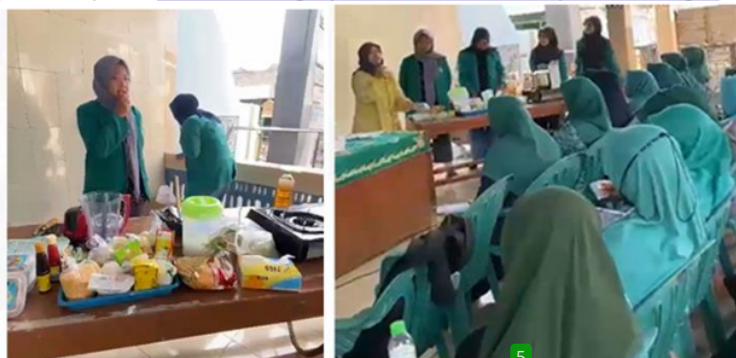
Gambar 2. Sosialisasi program dengan penyampaian materi, pelatihan pembuatan nugget dan bakso ikan serta FGD (forum group discussion).

Lamongan tahun 2020 sebanyak 3.880 kg dan banyak terdapat tempat pelelangan ikan (TPI) di Desa Weru, Paciran (Kabid Perikanan Tangkap Dinas Perikanan Kabupaten Lamongan, 2021).