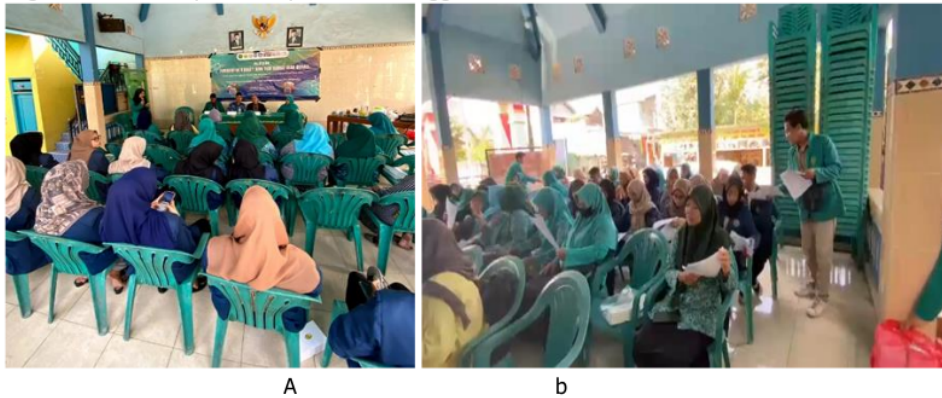
Gambar 1 a) Kegiatan pengabdian yang diawali dengan pembukaan dan b) Pengisian daftar hadir dan kuesioner sebagai evaluasi program.

Pre-tes diberikan di awal kegiatan sebelum sosialisasi program pengabdian, baru post-tes disajikan di akhir kegiatan sebagai tolak ukur keberhasilan kegiatan. Hasil jawaban kuesioner dilakukan perhitungan persentase jumlah pertanyaan benar, baru semua nilai hasil kuesioner direratakan. Hal yang sama juga untuk post test, sehingga rerata nilai tes (pre dan post) diperoleh, hasil nilai rerata tes disajikan dalam bentuk grafik batang, kemudian diolah dan dibahas secara statistika deskriptif. Peningkatan nilai rerata tes sebelum dan sesudah merupakan indikator keberhasilan, dimana adanya peningkatan pengetahuan dan wawasan masyarakat desa terkait kegiatan sosialisasi pelatihan pembuatan nugget dan bakso ikan.