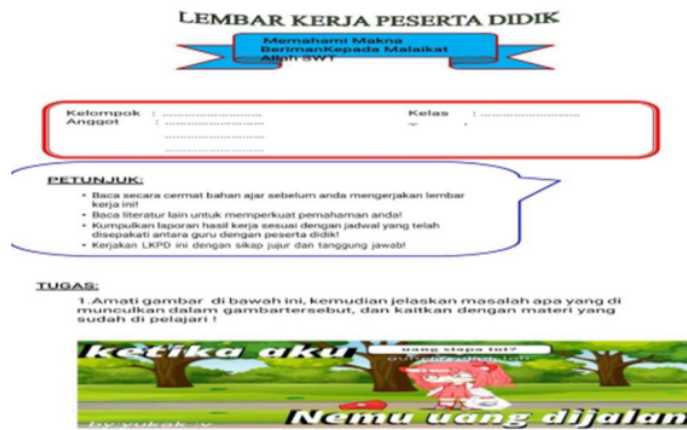
Gambar 1. Soal Memahami Makna Beriman Kepada Malikat

Pada pertemuan pertama di SMK Al-Islah, guru membentuk kelompok peserta didik menjadi lima kelompok. Setiap kelompok diberikan soal yang berisi pertanyaan, dan mereka diberi waktu untuk menyelesaikan. Selanjutnya, salah satu kelompok mempresentasikan masalah yang dihadapi berdasarkan soal tersebut. Dari kelima kelompok, terdapat tiga kelompok di SMK Al-Islah yang mengalami kesulitan dalam menyelesaikan tugasnya dengan baik. Oleh karena itu, perlu dilakukan evaluasi mendalam terhadap pemahaman dan penerapan PBL oleh setiap kelompok, serta diperlukan pembaruan strategi pembelajaran untuk membantu kelompok yang mengalami kesulitan. Hasil dari dua pertemuan tersebut menunjukkan bahwa guru membuka pembelajaran, menjelaskan materi, memberikan kertas soal, dan mengarahkan peserta didik untuk memperhatikan soal pada tabel yang telah disediakan.