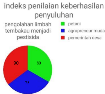
Gambar 7. Penilaian Penyuluhan

Berikut adalah beberapa contoh hasil dari penyuluhan yang diberikan kepada beberapa pemangku kepentingan yang terlibat dalam program penyuluhan pembuatan insektisida dari tembakau yakni sebagai berikut: