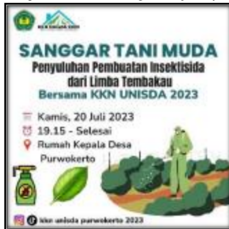
Gambar 4. Undangan untuk Petani Tembakau Desa Purwokerto

Membangun kerjasama dengan lembaga pendidikan, penelitian, dan pemerintah setempat untuk mendukung implementasi dan pengembangan pemanfaatan insektisida alami berbasis limbah tembakau. Kolaborasi ini dapat mencakup bantuan teknis, fasilitas penelitian, dan dukungan kebijakan yang relevan.