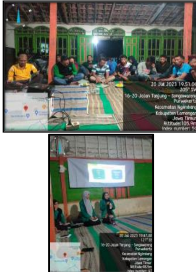
Gambar 5. Pelaksanaan Penyuluhan

penyuluhan [11]. Pengoperasian peralatan pengolahan seperti penggiling dan penyaring untuk menciptakan insektisida alami yang berkualitas, dan melakukan pengujian kualitas insektisida alami dalam sebelum dilakukan penyuluhan.