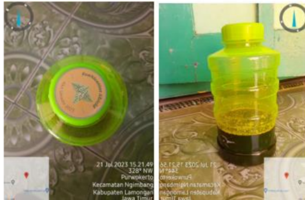
Gambar 6. Produk Insektisida