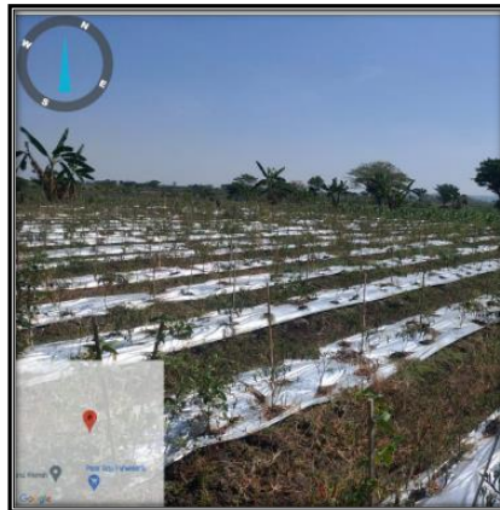
Gambar 2. Pertanian Tembakau Desa Purwokerto

Salah satu bentuk pengabdian yang diusulkan adalah pengolahan limbah tembakau menjadi insektisida alami. PKM ini bertujuan untuk meningkatkan produktivitas pertanian di Desa Purwokerto dengan memanfaatkan limbah tembakau sebagai insektisida alami. Melalui PKM ini, mahasiswa akan berperan dalam mengembangkan strategi dan metode untuk mengoptimalkan pemanfaatan limbah tembakau sebagai insektisida alami. Dengan penggunaan insektisida alami ini diharapkan dapat meningkatkan produktivitas pertanian [4]. Selain itu, PKM ini juga akan memberikan pendampingan dan pelatihan kepada agropreneur muda di desa tersebut. Dalam pelatihan ini, mahasiswa akan memberikan pengetahuan dan keterampilan kepada agropreneur muda mengenai penggunaan insektisida alami berbasis limbah tembakau, termasuk teknik aplikasi yang efektif dan pengendalian hama dan penyakit tanaman. Dengan melibatkan mahasiswa dan menerapkan solusi ini, diharapkan dapat terjadi peningkatan produktivitas pertanian di Desa Purwokerto. Pemanfaatan limbah tembakau sebagai insektisida alami juga akan memberikan dampak positif bagi lingkungan dan kesehatan manusia serta mengurangi penggunaan insektisida kimia yang berbahaya [5].