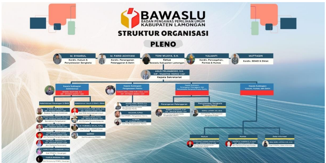
Gambar.2. Struktur Organisasi BAWASLU Lamongan

Penanganan Pelanggaran dan Data Informasi (Datin), Hukum dan Penyelesaian Sengketa, serta SDM dan Diklat–mencerminkan pendekatan yang komprehensif dan terorganisasi dalam menjalankan tugas pengawasan Pemilu. Setiap divisi memiliki peran yang esensial dan saling mendukung satu sama lain untuk memastikan pelaksanaan Pemilu di Kabupaten Lamongan berlangsung secara transparan, jujur, dan sesuai dengan ketentuan yang berlaku. Dengan pembagian tanggung jawab yang terstruktur dan koordinasi yang efektif antardivisi, Bawaslu Kabupaten Lamongan siap menghadapi tantangan pengawasan Pemilu 2024. Komitmen ini diharapkan dapat menjamin integritas di setiap tahapan Pemilu, sehingga menghasilkan pemilu yang tidak hanya sah secara hukum tetapi juga mendapatkan kepercayaan dan penerimaan dari masyarakat.