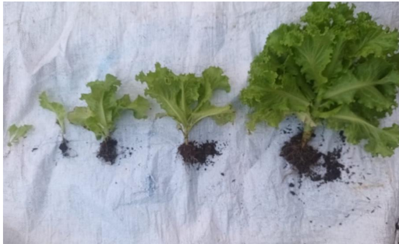
Proses Pengamatan Panjang Akar Tanaman