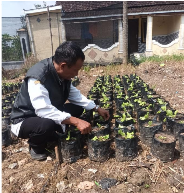
Proses Pengamatan Tinggi dan Jumlah Daun Tanaman