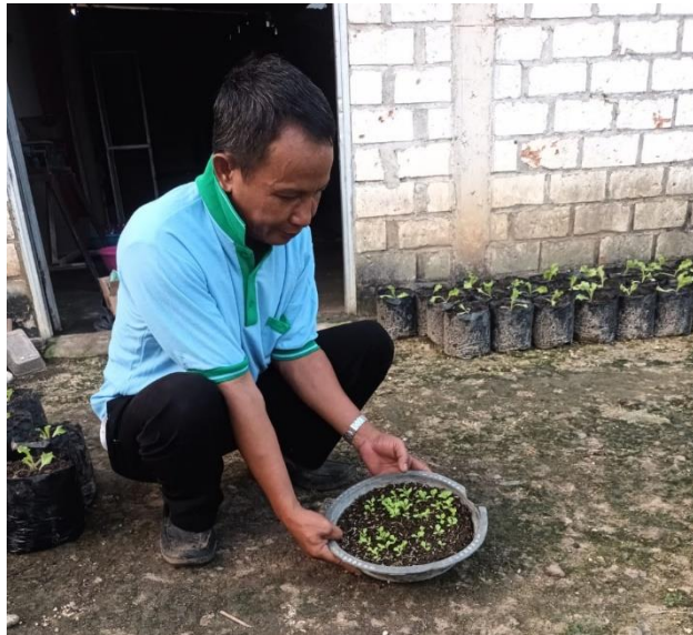
Proses Penyemaian Selada Hijau Keriting