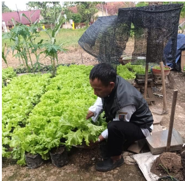
Proses Panen Tanaman Selada Hijau Keriting