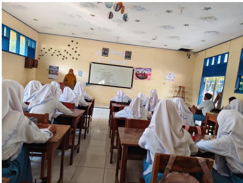
Memperhatikan guru saat memberikan contoh biografi tokoh.