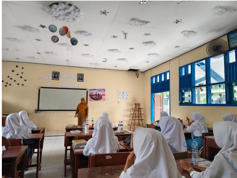
Peserta didik sedang memperhatikan guru saat menjelaskan teks biografi.