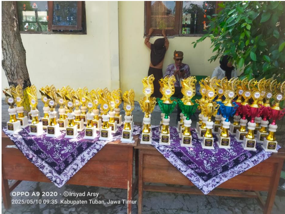
OPPO A9 2020 · ©Irsyad Arsy 2025/05/10 09:35 Kabupaten Tuban, Jawa Timur