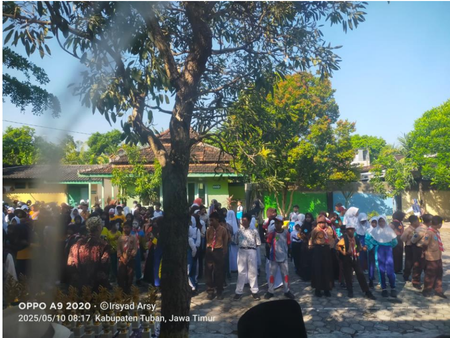
OPPO A9 2020 · ©Irsyad Arsy 2025/05/10 08:17 Kabupaten Tuban, Jawa Timur