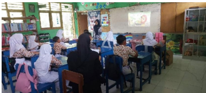
Guru mengajak siswa bercerita tentang video menarik yang pernah mereka tonton. Guru mengaitkan pengalaman siswa dengan materi menulis cerita.