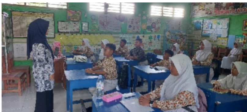
Guru membuka pembelajaran dengan salam, menanyakan kabar, dan mengecek kehadiran siswa.