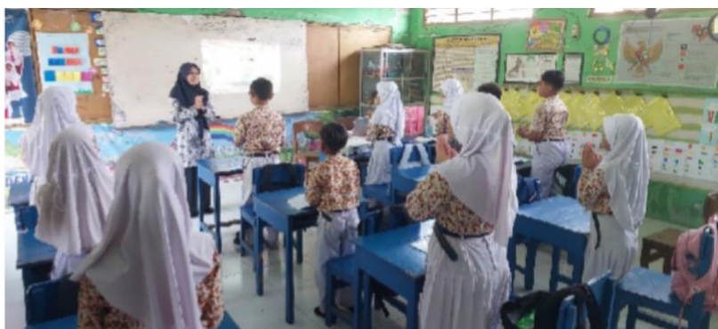
Guru membangkitkan semangat belajar siswa, dengan melakukan tepuk semangat