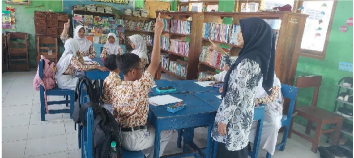
Guru membimbing siswa untuk merefleksikan pembelajaran yang telah dilakukan