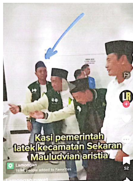
Pengawasan media sosial yang melibatkan salah satu perangkat desa di Lamongan

Dengan demikian, peran media sosial dalam pelanggaran netralitas ASN di Kabupaten Lamongan pada Pilkada 2024 bersifat ambivalen. Di satu sisi, media sosial memperluas bentuk pelanggaran karena ASN dan aparatur desa dapat dengan mudah menunjukkan keberpihakan politik secara terbuka. Di sisi lain, media sosial juga memperkuat mekanisme pengawasan dan pembuktian karena jejak digital dapat dijadikan bukti yang sah dalam proses klarifikasi. Oleh karena itu, Bawaslu Lamongan perlu mengoptimalkan strategi pengawasan digital, termasuk meningkatkan kapasitas aparat pengawas dalam mendeteksi dan memverifikasi bukti digital, agar penegakan hukum terhadap pelanggaran netralitas ASN dapat berjalan lebih efektif dan adaptif terhadap perkembangan teknologi informasi.