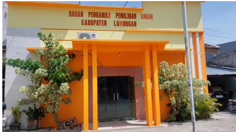
Gambar 4.1 Kantor Bawaslu Kabupaten Lamongan