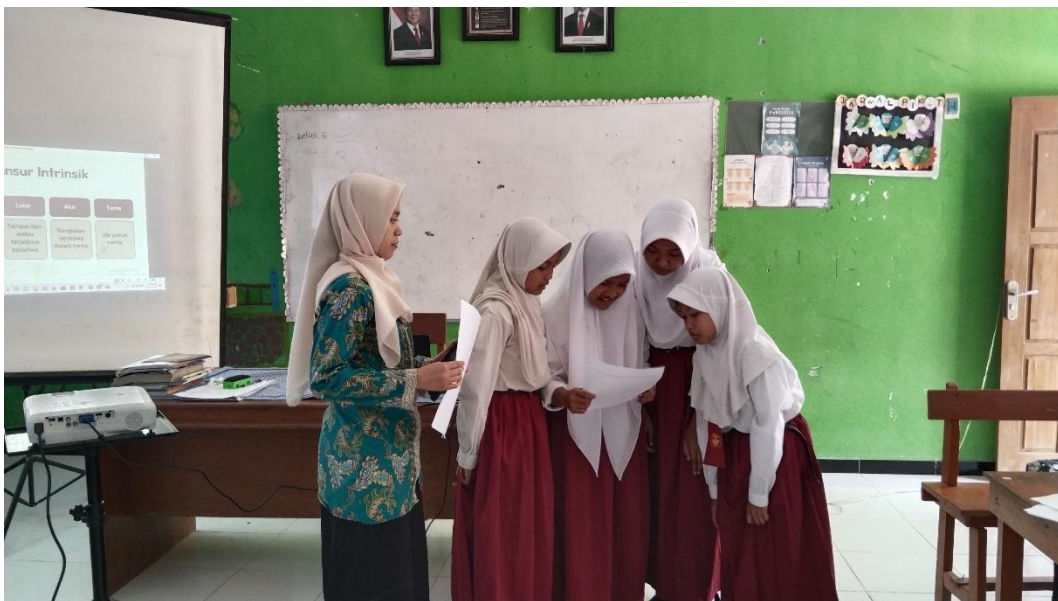
Siswa mempresentasikan hasil kerja kelompok.