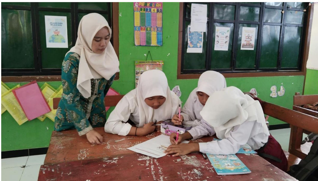
Guru membagi peserta didik ke dalam kelompok kecil (3-4 orang). Setiap kelompok diminta mendiskusikannya