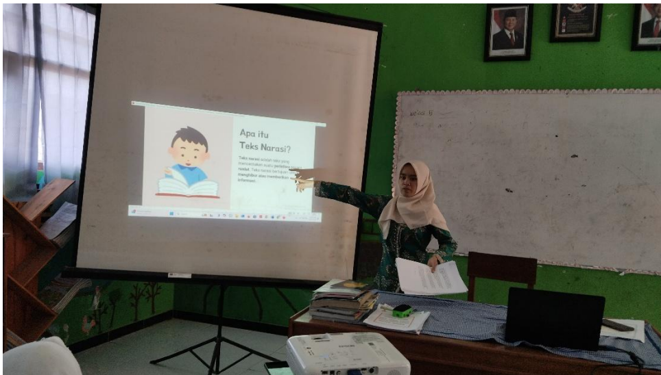
Guru mengajukan pertanyaan pemantik