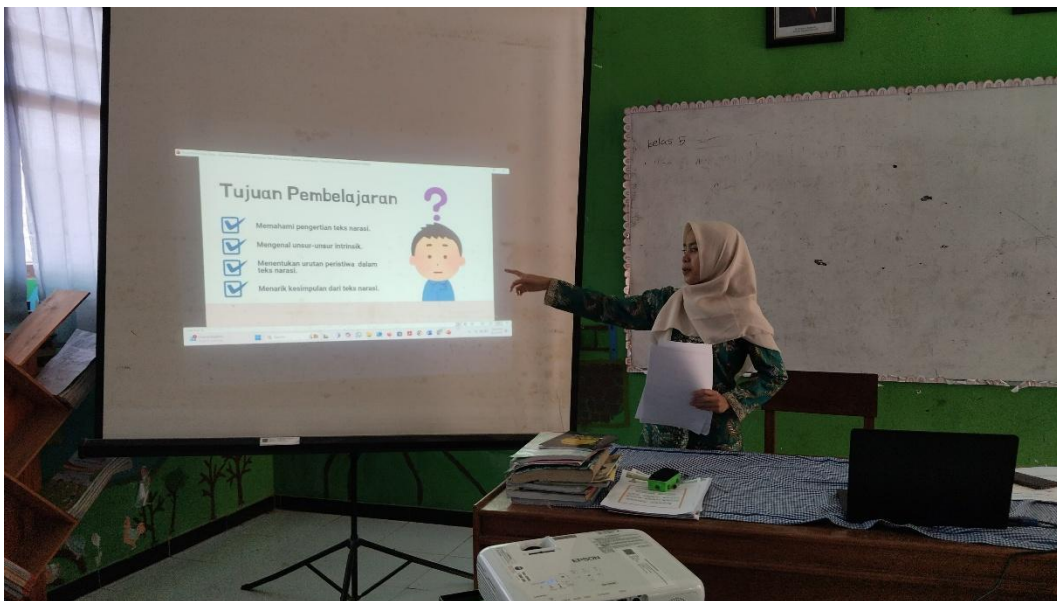
Guru menyampaikan Tujuan Pembelajaran