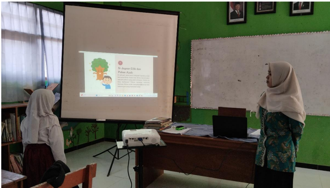
Guru menunjukkan contoh teks narasi dan meminta peserta didik untuk membacaknya