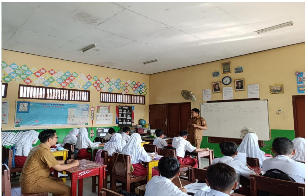
Guru Kelas VI memastikan materi puisi kepada anak di SD Negeri Ngulanan I