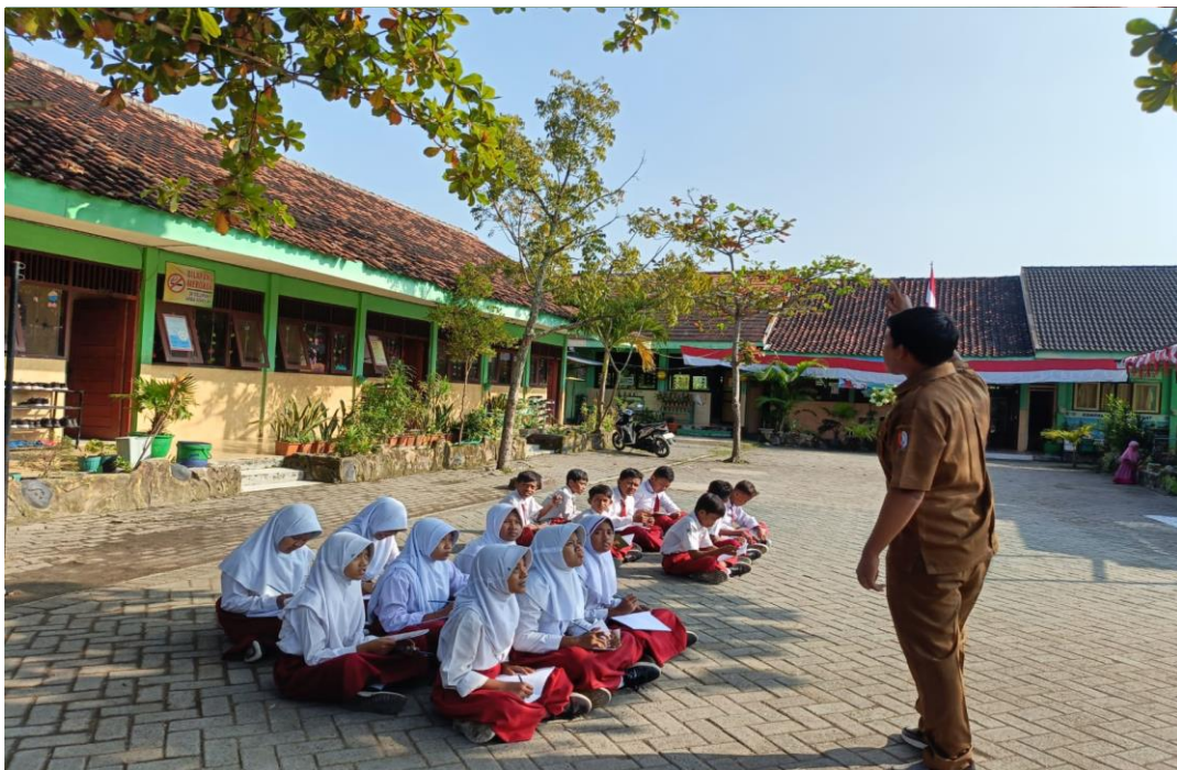
Guru kelas VI melakukan bimbingan menulis puisi di SD Negeri Ngulanan I