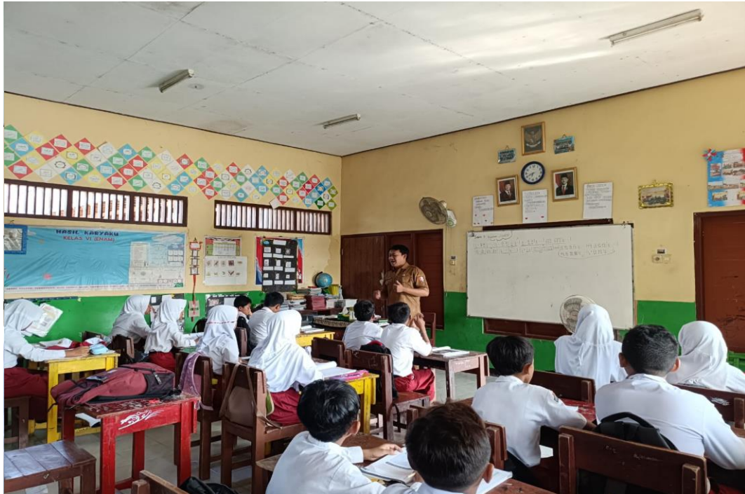
Guru Kelas VI melakukan absensi kehadiran di SD Negeri Ngulanan I