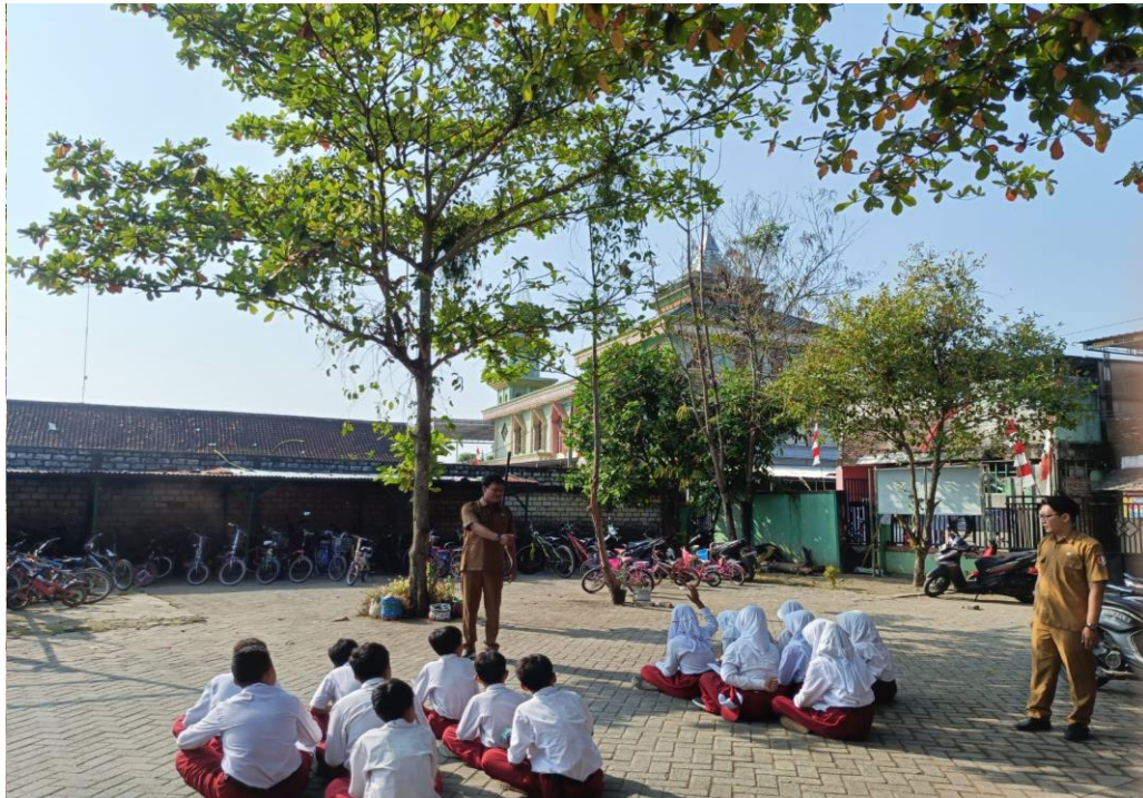
Siswa Kelas VI berlatih menulis puisi di halaman SD Negeri Ngulanan I