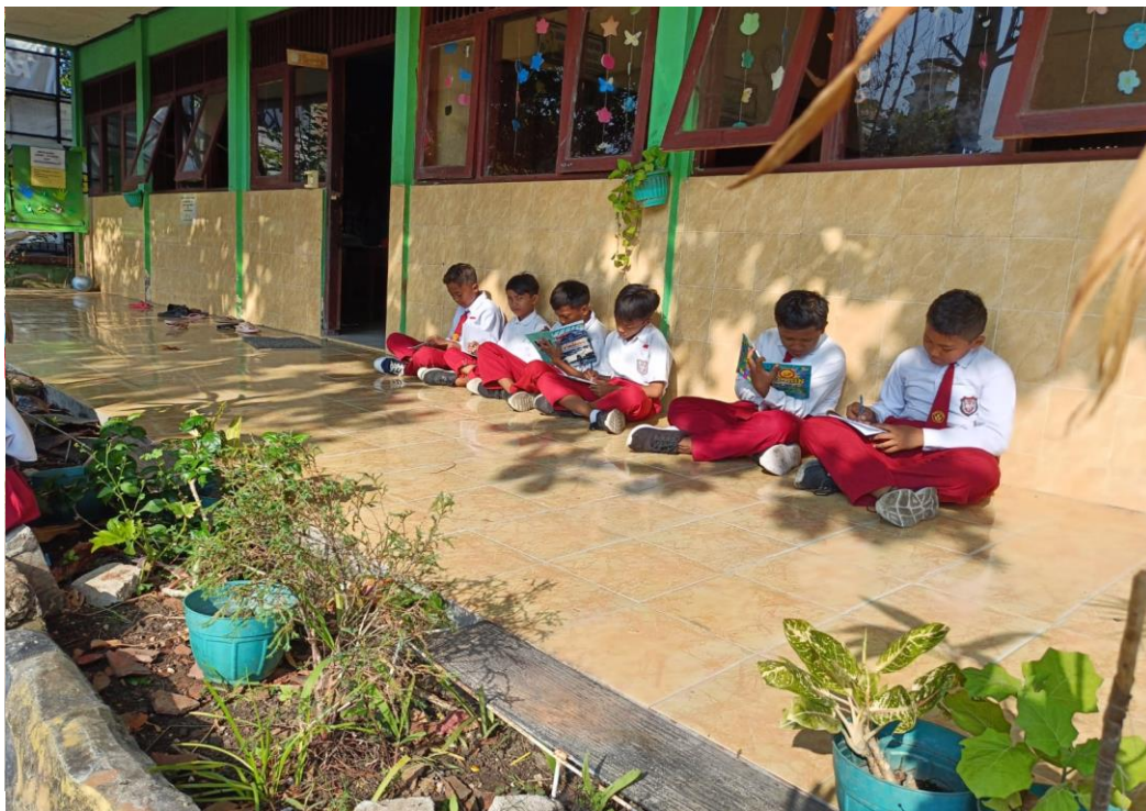
Siswa Kelas VI berlatih menulis puisi di halaman SD Negeri Ngulanan I