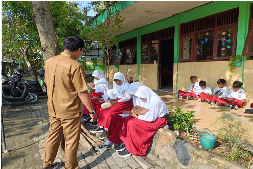
Guru kelas VI melakukan bimbingan menulis puisi di SD Negeri Ngulanan I