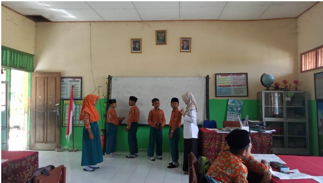
Siswa memerankan dialog dengan bimbingan guru