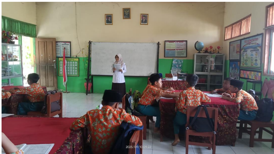
Guru menjelaskan tentang bermain peran