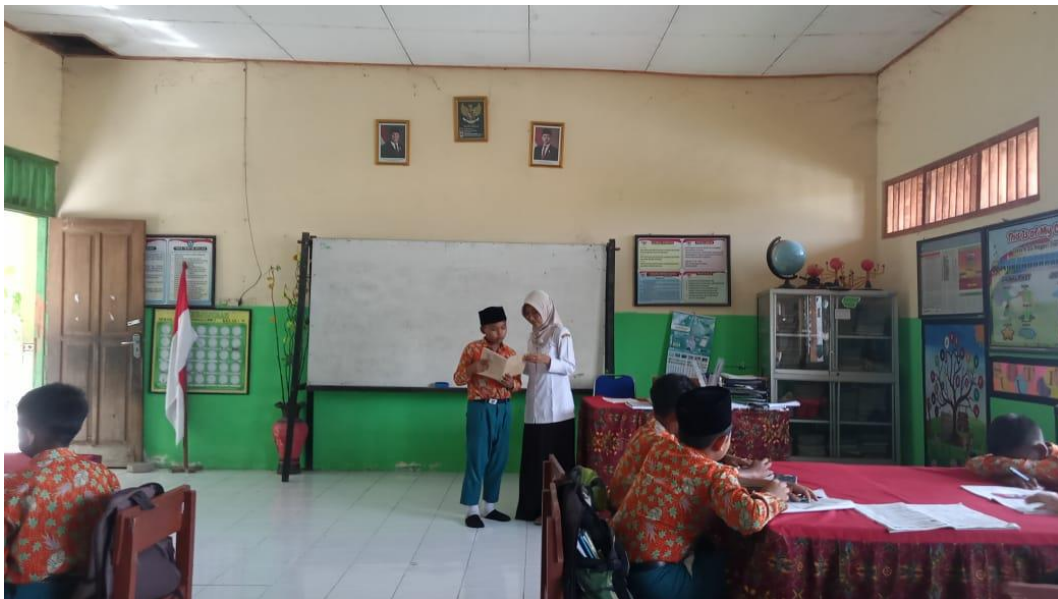
Refleksi Dan Evaluasi