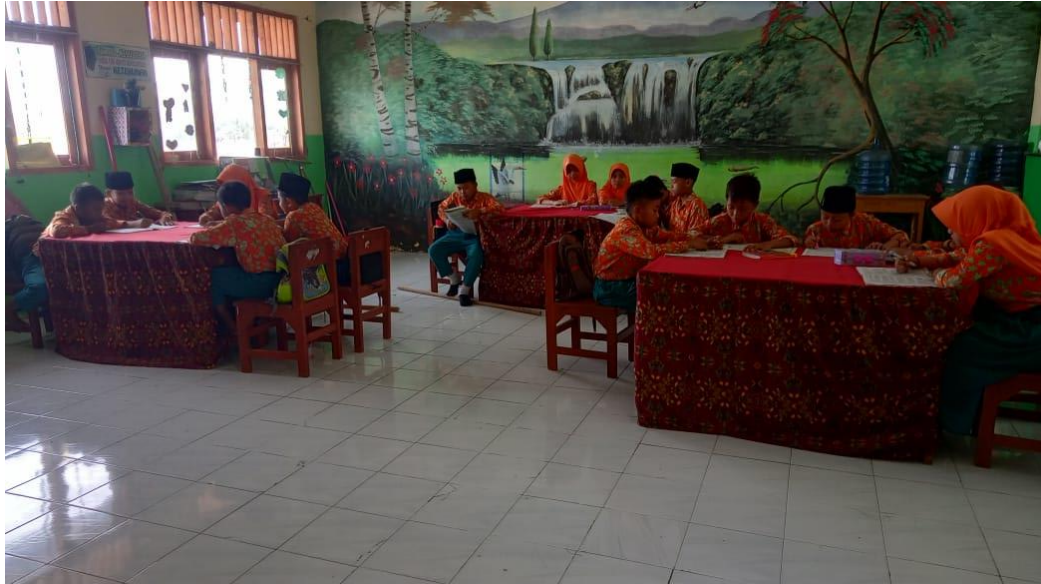
Guru Membagi Siswa Dalam Beberapa Kelompok