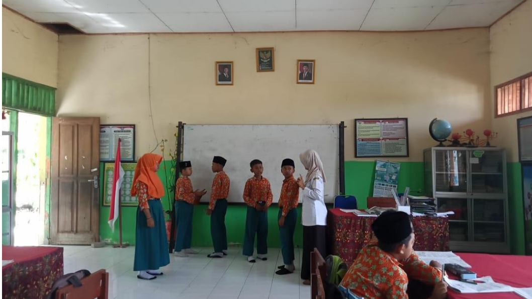
Guru memberikan bimbingan selama aktivitas bermain peran