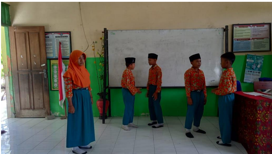
Masing-masing kelompok tampil di depan kelas