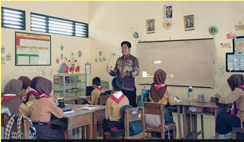
Gambar 1 . Siswa menyimak penjelasan guru terkait tujuan pembelajaran penulisan teks informatif sesuai

Lampiran 2 kegiatan siswa pada penerapan model kontekstual (ctl) dalam pembelajaran menulis teks informatif kelas V SD Negeri Nglajang Sugihwaras Bojonegoro.