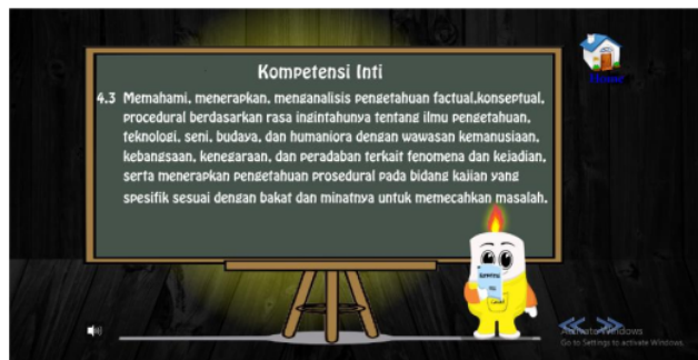
Gambar 2 menu kompetensi media interaktif berbasis kartun

Deskripsi dari masing-masing menu media interaktif berbasis kartun materi suhu dan kalor adalah sebagai berikut.