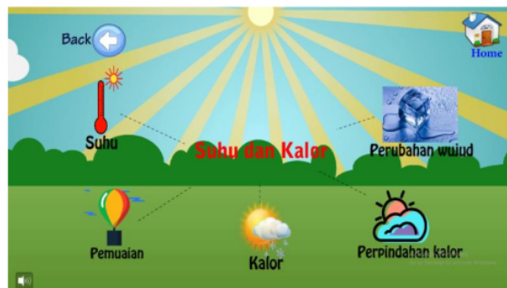
Gambar 5 menu materi media interaktif berbasis kartun

36 Menu belajar ini terdiri dari 2 menu yaitu menu materi dan menu video. Di dalam menu materi berisi tentang materi suhu dan kalor yang terdiri dari 5 menu yaitu menu suhu, menu pemuain, menu kalor, menu perpindahan kalor, dan yang terakhir menu perubahan wujud, disajikan seperti pada gambar berikut.