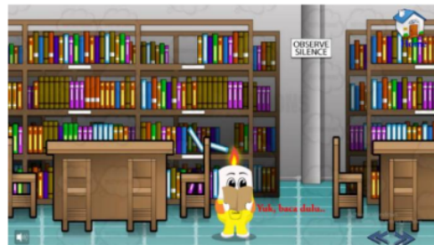
Gambar 3 menu baca aku media interaktif berbasis kartun

Menu kompetensi berisi tentang kompetensi inti, kompetensi dasar, dan indikator