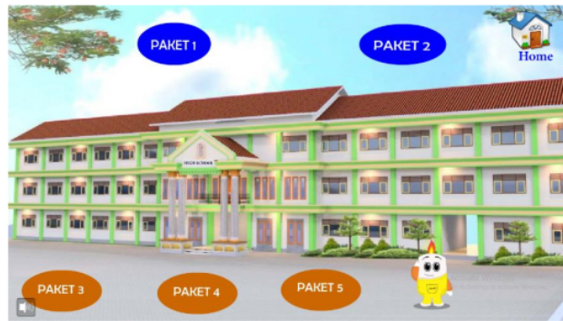
Gambar 8 menu test media interaktif berbasis kartun

Menu bermain pada gambar di atas terdiri 2 simulasi virtual lab yang terdiri dari virtual lab 1 dan virtual lab 2 yang berisi tentang simulasi materi suhu dan kalor agar peserta didik lebih memahami materi.