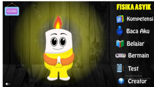
Gambar 1 halaman utama media interaktif berbasis kartun

Media interaktif berbasis kartun didesain dalam satu tampilan yang mencakup kompetensi, materi, video praktikum, simulasi, serta latihan soal secara menyeluruh sehingga lebih efisien. Rekonstruksi media ini terdapat 6 menu yaitu menu kompetensi, menu baca aku, menu belajar, menu bermain, menu test , dan menu creator . Tokoh utama dalam media interaktif berbasis kartun ini adalah candle . Berikut halaman awal dari media interaktif berbasis kartun.