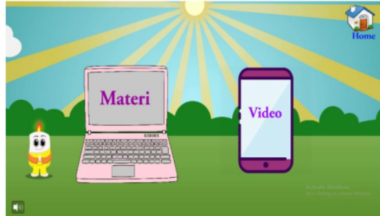
Gambar 4 menu belajar media interaktif berbasis kartun

1 https://jurnal.unsulbar.ac.id/index.php/saintifik