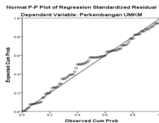
Gambar 1. Uji Normalitas

Dari gambar probability plot menunjukkan bahwa barisan titik-titik relative mendekati garis lurus, sehingga dapat disimpulkan bahwa data residual terdistribusi normal. Hasil uji normalitas seperti gambar dibawah ini: