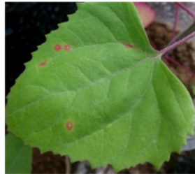
Gambar 1. Gejala lesio lokal pada C. amaranticolor yang diinokulasi TuMV

Berdasarkan hasil pengamatan pada tanaman indikator yang diinokulasi TuMV terdapat masa inkubasi yaitu lamanya keberhasilan virus masuk dan memperbanyak diri didalam jaringan tanaman. Tanaman inang yang dijadikan indikator adalah Chenopodium amaranticolor L. gejala muncul pada 8 hari setelah inokulasi. Gejala yang ditimbulkan yaitu gejala lesio lokal atau bercak yang membentuk spot-spot pada daun tanaman indikator ( C. amaranticolor ) yang diinokulasi TuMV (Gambar 1) . Hal ini sesuai dengan penelitian yang dilakukan oleh Choliq et al. (2018) bahwa C. amaranticolor yang terserang TuMV akan menimbulkan gejala yang nampak pada daun yaitu gejala lesio local nekrosis. Namun, dari gejala dan diagnosa tanaman C. amaranticolor yang disebabkan oleh TuMV menunjukkan gejala lokal klorotik lesio (bercak kuning hingga kemerahan berbentuk spot) dan tidak sistemik (Plant Virus Online, 2016).