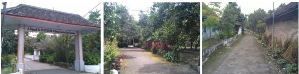
Gambar 3. Kondisi lingkungan permukiman di Kecamatan Tulangan

Menurut tipologi, perumahan dan permukiman yang terdapat dalam kecamatan Tulangan diklasifikasikan sebagai pada tipologi likuidasi pedesaan. Berdasarkan pengamatan yang dilakukan, kondisi fisik likuidasi di Kecamatan Tulangan sangat bervariasi. Tetapi tergantung pada pengamatan yang dilakukan secara menyeluruh, sebagian besar kondisi perumahan di subdit TULANGAN dapat diklasifikasikan ke permukiman yang dapat dihuni.