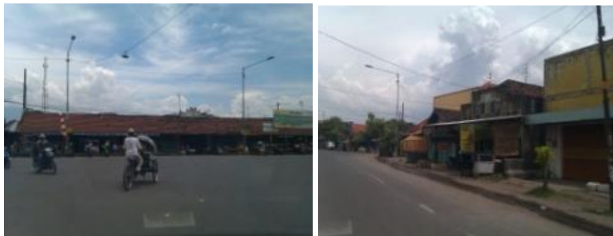
Gambar 6 Pertumbuhan sektor perdagangan di Kecamatan Tulangan

Keberadaan Pusat Kegiatan Komersial (dalam bentuk pasar) yang berlokasi di desa Wonoayu, berkontribusi pada sektor pertumbuhan di Kecamatan Tulangan. Keberadaan pasar ini berdampak pada tren pertumbuhan toko-toko toko (toko) yang terletak di sepanjang jalan raya besar di Distrik Tulangan.