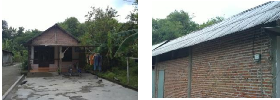
Gambar 4. Pemanfaatan material bangunan berbahaya pada fisik bangunan rumah