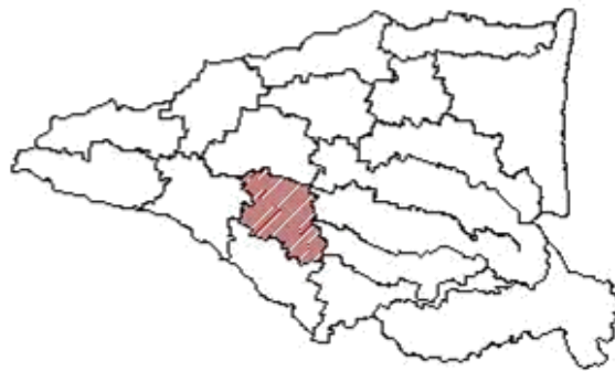
Gambar 1 Lokasi Kecamatan Tulangan dalam administrasi Kabupaten Sidoarjo

Perkembangan berbagai sektor juga harus dipandu oleh perjanjian keseluruhan, yaitu tujuan pengembangan agenda 21 dan milenium (MDG). Agenda 21 adalah pedoman pengembangan global yang berfungsi sebagai arahan dalam pengembangan pembangunan di berbagai bagian dunia. Sedangkan MDG lebih tentang cita-cita dan komitmen jangka panjang kepada dunia untuk mencapai kehidupan manusia yang lebih baik dan peraturan kota global sehingga proses pembangunan yang ada selalu dapat dipandu oleh prinsip live yang berkelanjutan. Posisi penelitian ini adalah proses sinkronisasi antara konteks lokal (Fakta Lapangan) dari peraturan daerah (IDR4D) yang dikaitkan dengan kebijakan global (Agenda 21 dan MDG). Dengan demikian, seseorang dapat mengetahui sejauh mana upaya yang telah dilakukan akan mencapai kesuksesan dan pada semua yang perlu ditingkatkan dalam pengembangan di masa depan. Untuk mendukung penulisan ini, proses penelitian ini dilakukan dengan melakukan tinjauan kontekstual dari proses dan hasil pembangunan yang dilakukan, terutama di Kabupaten Sidoarjo, Jawa Timur. Ruang lingkup area yang digunakan dalam penelitian ini adalah salah satu kecamatan yang termasuk dalam pemerintahan Kabupaten Sidoarjo, yaitu Kabupaten Tulangan. Berikut ini adalah orientasi peta lokasi kecamatan Tulangan dalam administrasi Kabupaten Sidoarjo.