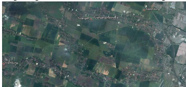
Gambar 2. Visualisasi persebaran lahan terbangun terhadap keberadaan jaringan jalan

Berdasarkan pada jenis pemanfaatan lahannya, Kecamatan Tulangan terdiri dari beberapa jenis kegiatan pemanfaatan lahan. Pemanfaatan lahan ini didominasi oleh peruntukan permukiman mandiri dengan tipologi permukiman pedesaan dan kegiatan pertanian-perkebunan & budidaya tambak. Komposisi pemanfaatan lahan lainnya adalah kegiatan perdagangan dan jasa yang mayoritas adalah tergolong kedalam sektor non-formal dengan skala pelayanan lokal.